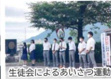
生徒会によるあいさつ運動

10 OCT ●華の丘祭 (文化の部・体育の部) ●2学期中間考査 ●生徒会役員選挙