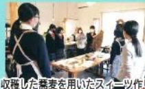
収穫した蕎麦を用いたスイーツ作り