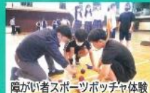
障がい者スポーツポッチャ体験