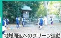
地域周辺へのクリーン運動