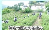
湊名地区での茶摘み