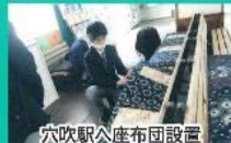
穴吹駅入座布団設置