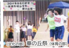
(文化の部) 華の丘祭 (体育の部)

10 OCT ●華の丘祭 (文化の部・体育の部) ●2学期中間考査 ●生徒会役員選挙