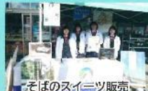
そばのスイーツ販売