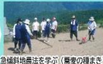
急傾斜地農法を学ぶ（蕎麦の種まき）