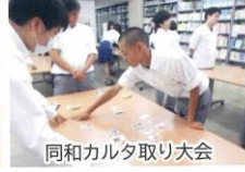
同和カルタ取り大会

6 JUN ●県高校総合体育大会 ●四国高校総合体育大会 ●校内同和カルタ取り大会