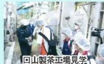
回山製茶工場見学