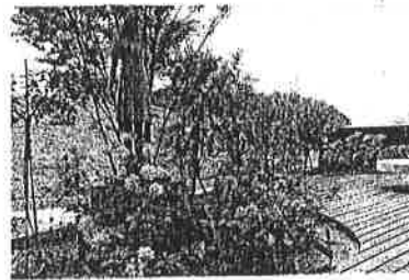
アンネの形見のバラ